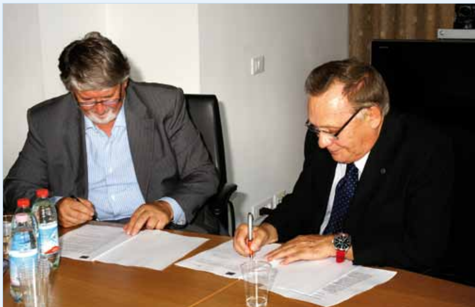
Roma, 20 luglio 2010. Il presidente della Legacoop Giuliano Poletti ed il Presidente della CIU Corrado Rossitto

Cooperative del sapere: Legacoop e CIU rafforzano l'impegno di promozione; al via una cabina di regia nazionale, l'ampliamento delle attività di formazione e condizioni di favore per i finanziamenti