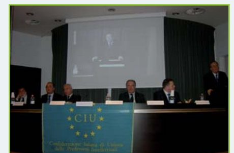
Forum CIU a Pescara

FORUM CIU A PESCARA IN EUROPA AUMENTANO I POSTI DEL LAVORO ALTAMENTE QUALIFICATO SARANNO IL 35% DELLA FORZA LAVORO ENTRO IL 2020.