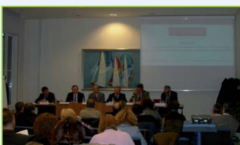
Il seminario a Trieste

TRIESTE SEMINARIO CIU ROSSITTO: L'EUROPA CHIEDE MOBILITA' COMUNITARIA PER LE ALTE PROFESSIONALITA' DEL PUBBLICO IMPIEGO MA IN ITALIA BISOGNA APPLICARE LA LEGGE SUI QUADRI.