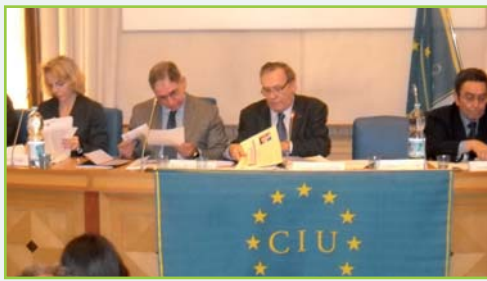
Il Forum al Cnel

FORUM CIU AL CNEL: CAMBIA L'ECONOMIA EUROPEA DELLE PROFESSIONI INTELLETTUALI. TRASVERSALITÀ TRA LAVORO DIRETTIVO E LIBERE PROFESSIONI.