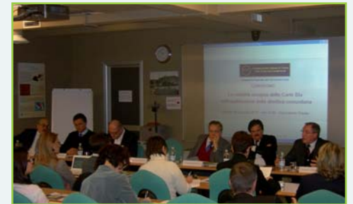
Il convegno a Trieste

CERVELLI STRANIERI (CARTE BLU): L'EUROPA AL 2%, L'ITALIA AL 2,9% IL FRIULI VENEZIA GIULIA QUASI AL 7%. ROSSITTO: LA SPAGNA HA RECEPITO A DICEMBRE LA DIRETTIVA SULLE CARTE BLU. CIU SOLLECITA IL GOVERNO ITALIANO.