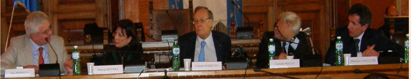
Una fase del Convegno di Bari.

Supplemento a "Professioni Intellettuali" – Autorizzazione del Tribunale di Roma n.45 del 14-2-2006