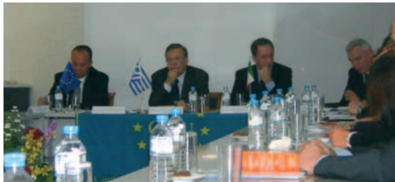
Atene, incontro con i professionisti italiani all'estero

Dalla situazione sopra illustrata ed in considerazione dell'odierna tendenza demografica negativa, del quadro normativo europeo, emerge con urgenza la necessità di arricchire il mondo delle professioni liberali attraverso l'incentivo ad una mobilità che garantisca, ai liberi professionisti, l'acquisizione di conoscenza nei diversi Stati europei senza però che vengano meno le certezze ri-